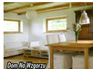
Dom Na Wzgórzu