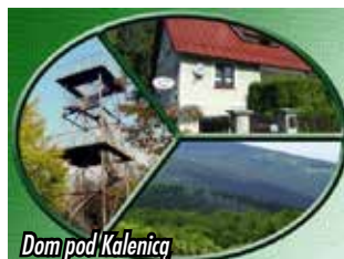
Dom pod Kalenicą

Jeżdżąc na nartach w Jugowie lub wybierając się na wieżę widokową na Kalenicy (964 m n.p.m.), posilimy się w „Barze Górskim Jugówka” (Bar Górski Jugówka, ul. Świętojańska 35, 57-430 JUGÓW) , „Zygmuntówce” (Gastronomia Schronisko Zygmuntówka, ul. Świętojańska 30, 57-450 JUGÓW) lub „Bukowej Chacie” Bukowa Chata, ul. Świętojańska 31, 57-450 JUGÓW). W centrum wsi zatrzymamy się także w kawiarni „Tina” (Kawiarnia Tina, ul. Główna 46, 57-4530 JUGÓW) lub pizzerii „Dobre Miejsce” (ul. Główna 91, 57-450 Jugów, tel. 74 873 64 34).