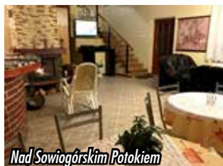
Nad Sowiogórskim Potokiem

Mamy tu duży wybór zadbanej rodzinnych agroturystyk i pokoi gościnnych: „Nad Sowiogórskim Potokiem” (ul. Sikorskiego 3, 57-430 Jugów, tel. 74 871 84 53, www.sudety-noclegi.pl ), „Ale Lipa” („Chata Ale Lipa”, ul. Sikorskiego 36, 57-450 Jugów, tel. +48 784 169 100, www.chataalelipa.pl ), „Jaworowy Stok” (Pokoje Gościnne „Jaworowy Stok” Jugów, ul. Gen. Sikorskiego 31b, tel. 74 871 83 56, +48 607 306 002, +48 609 145 459, www.jaworowystok.com ), „U Władzia” ul. Małachowskiego 28, 57-430 Jugów, tel. 74 871 83 03, www.uwladzia-jugow.superturystyka.pl ), „Dom Pod Kalenicą” (ul. 1 Maja 19a, 57-430 Jugów, tel. 74 873