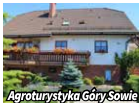
Agroturystyka Góry Sowie

► Niecały kilometr niżej, jadąc w kierunku Ludwikowic Kłodzkich dojedziemy do „Grupy Harenda” ( www.harenda.biz.pl ul. Kasprowicza 34, 57-450 Ludwikowice Kłodzkie – SOKOLEC).